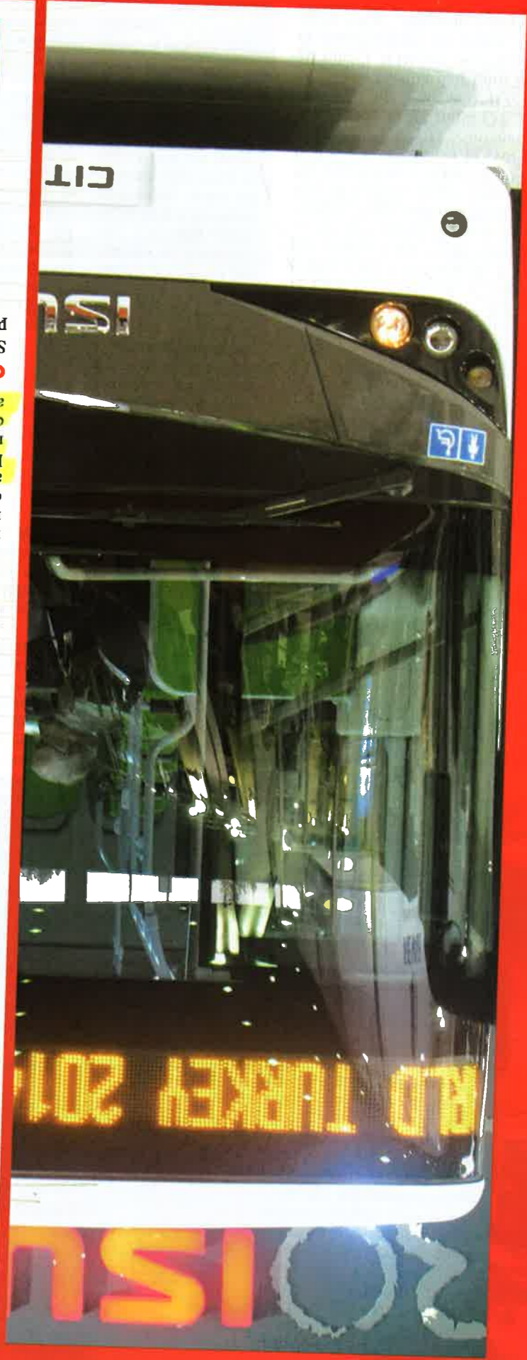
Grande folla alla prima del Setra serie 500. Mentre Isuzu punta tutto sui modelli urban. Euro VI ovviamente che a breve arriveranno anche in Italia.

Stand della grandi occasioni per Otokar che gioca in casa e gamma completa per il Tur-pedana disabili. Insomma una la bagagliaiera) e il Kent U da 12 metri sempre in Euro 5 con Doruk T da 10 metri (al top A chiudere l'offerta Otokar i da 8,3 (entrambi in euro 5). ma da 7,1 metri e la seconda le versioni S e Mega, la prima la presenza dei costruttori di gli Sultan (Navigo) pensano metri. A completare la famiglia tra l'Euro 2 e l'Euro 3. Buono tra l'Euro 2 e l'Euro 3. Buono livello di emissioni che oscillano del profondo Est ancora legati a restano tanto curiosità e costruttori Sultan Maxi (Navigo U) da 7,7 metri in versione turismo della gamma Setra S500. Per il Euro VI by Isuzu e il lancio la presentazione di un urbano sono mancate le chicche come Euro VI by Isuzu e il lancio ancora terra di conquista. Non solo per l'Europa considerata ad Est con un occhio di riguardo per l'Europa considerata picchiano forte. Ecco in sintesi il Busworld Turkey 2014 che si conferma un appuntamento legato al mercato interno e quello ad Est con un occhio di riguardo per l'Europa considerata ancora terra di conquista. Non solo per l'Europa considerata